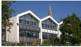
GEMEINDE TRAMIN, BIOMASSE-NAHWÄRME- ZENTRALE