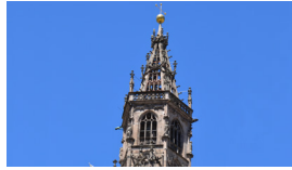
NAHWÄRMEZENTRALE DOM Bozen