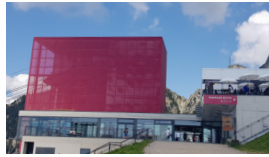
BERGBAHNEN MERAN 2000 AG