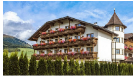
HOTEL FICHTENHOF Meransen