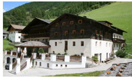
HOTEL RAINHOF Schnals