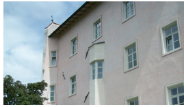
BILDUNGSCHAUS ST. GEORG DER CUSANUS AKADEMIE Sarns