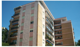
KONDOMINIUM CORSO ITALIA 3, 58 WOHNUNGEN Bozen