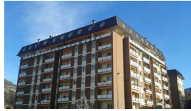
KONDOMINIUM CAPRI, 49 WOHNUNGEN Bozen