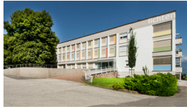
BILDUNGSCHAUS LICHTENBURG Nals